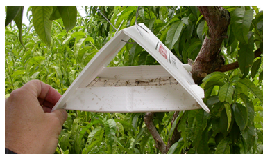
Fig. 5 Trampa Delta