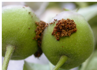
Fig. 4 Salida de excremento de la polilla de manzana