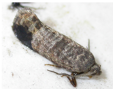
Fig. 1. Polilla de la