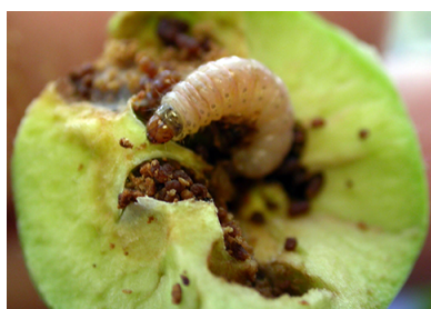
Fig. 2. Larva de Polilla de